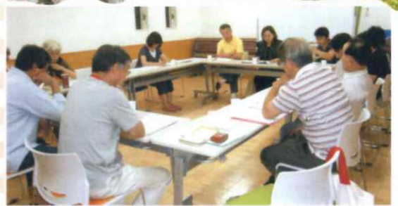
役員会 (自治会館さくらんぼにて)