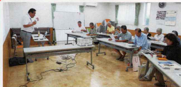
9月10日、「さくらんぼ」にて自主防災出前講座