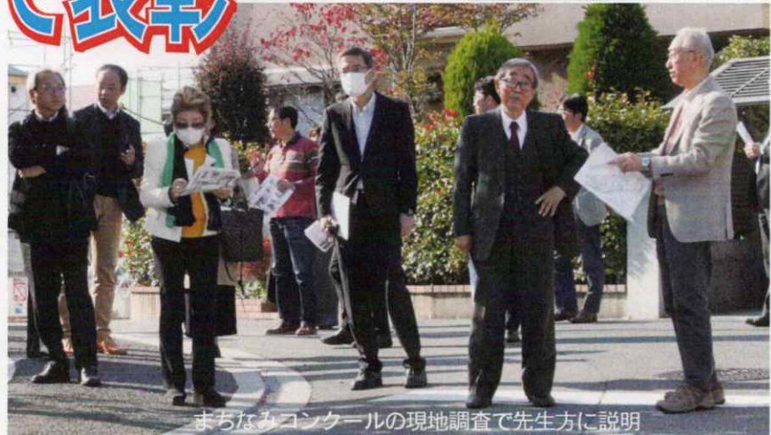
まちなみコンクールの現地調査で先生方に説明