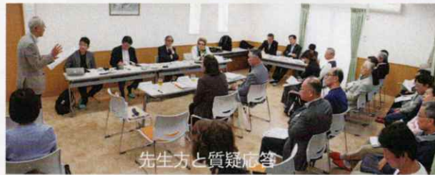
先生方と質疑応答

私たちのまちは平成9年に「豊中市都市デザイン賞」に、平成28年に「大阪まちづくり功労者賞」で表彰を受けましたが、今回国土交通省から表