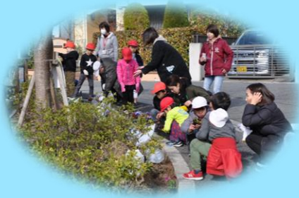
1年生が頑張って植えてくれました。

2月19日 1年生の保護者の皆さんの付き添いで、永楽荘3丁目第2公園に移植しました。通学路がフラワーロードになり、冬のまちなみに彩りを添えていただきました。ありがとうございました。