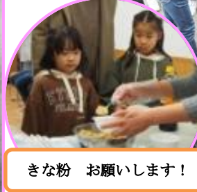
きな粉 お願いします!