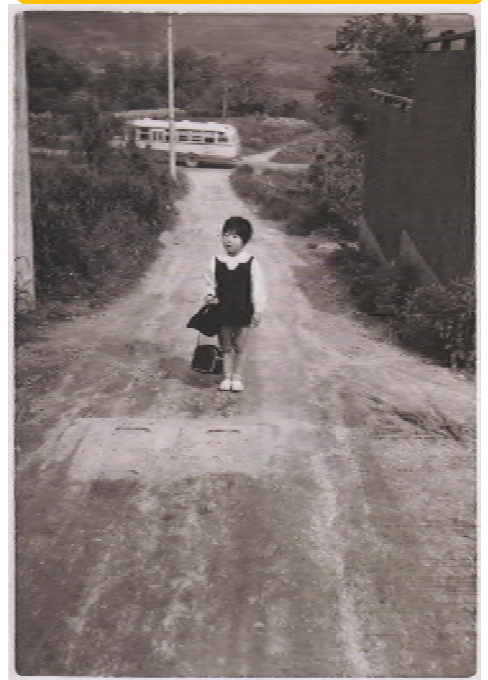
写真2 左：昭和34年頃 右：令和3年